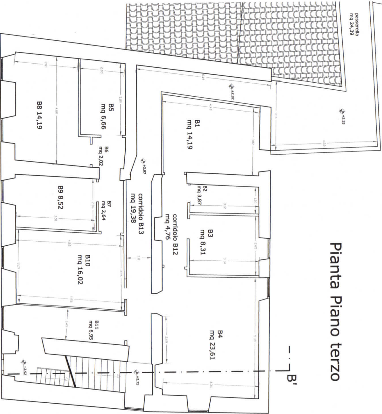
Riepilogo metri quadrati stanze: Sottotetto